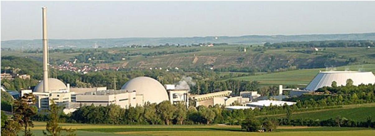
ネッカーウェストハイム原子力発電所の原子炉1号機(左)、排気塔(左)、原子炉2号機(中)、冷却塔(右)

※運営事業者発表の数値。石炭・褐炭発電と比較して。