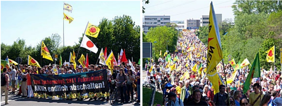
デモ行進の先頭。横断幕には「1986チェルノブイリ、2011フクシマ／原発を止める!」と書かれている(左)、壮観8000人。この日、全国で開催されたデモやイベントの参加者は計12万人(右)

例えば原発推進の立場をとる与党CDU(キリスト教民主同盟)支持者であっても、「他の政策は支持するが原発には反対」ならば気軽に参加できる。