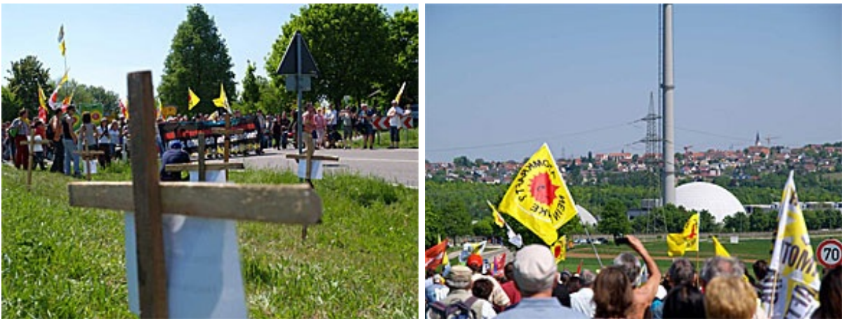
チェルノブイリ犠牲者の名を刻んだ十字架を前にデモ行進は一時停止(左)、原子炉1号機と排気塔(右)

25年前、チェルノブイリで実際に流された避難放送の録音だ。十字架には消火活動で命を落とした作業員の名前が刻まれている。筆者を含め、デモ行進を取材する20人余りの報道関係者が「最高の絵」を撮ろうとせわしなく動き回る。主催者があらかじめ用意したこの演出を「さすが」と思うか「ずる賢い」ととるかは人それぞれだが、長年の経験に裏打ちされた「したたかさ」で最大のPR効果を発揮したことは間違いない。