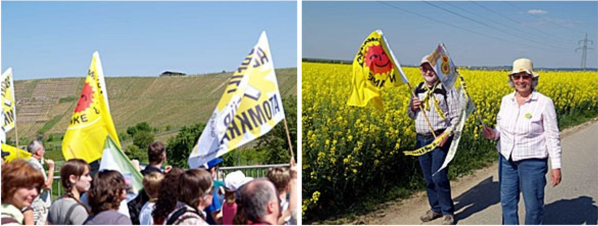
ネッカー川沿いの丘陵に広がるブドウ畑(左)、満開の菜の花をバックに。旗の「太陽マーク」は反原発の統一シンボル。「原発からソーラーへ(再生可能エネルギーの象徴として)」のメッセージ(右)