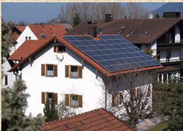
一般的な戸建て住宅と太陽電池

さて次回は再生可能エネルギー法をもう少し掘り下げ、その成功の秘密を探ってみます。